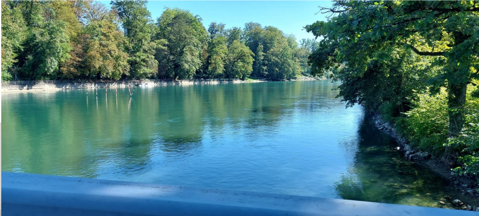
Blick auf den Parcours der Pontoniere