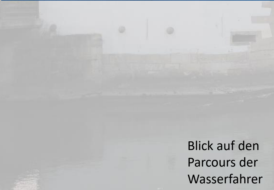
Blick auf den Parcours der Wasserfahrer